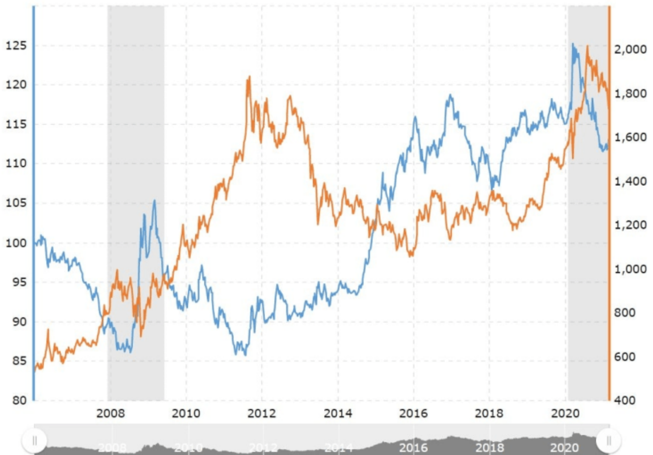
Goldpreis und US-Dollar-Wert von 2006 bis 2021.