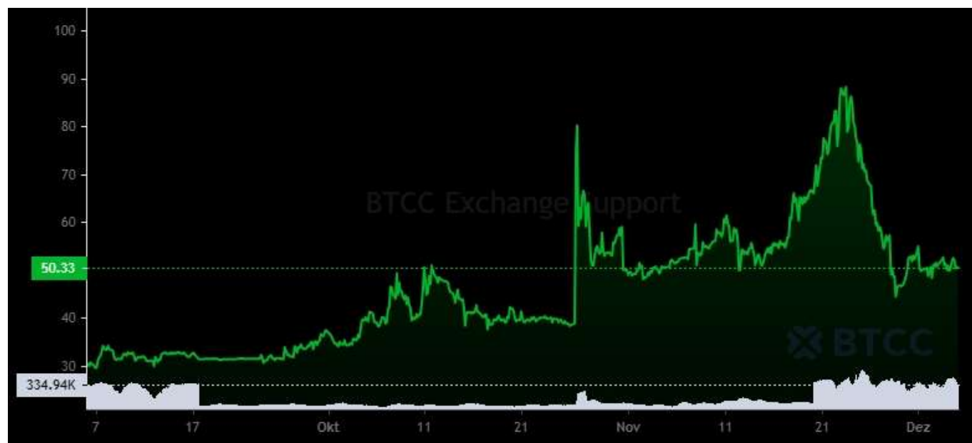
Pi Network Value in den letzten drei Monaten

Da die Hoffnungen auf den Start von Pi Network Mainnet in diesem Jahr schwinden, ist der Preis von Pi Network in der vergangenen Woche tendenziell gesunken.