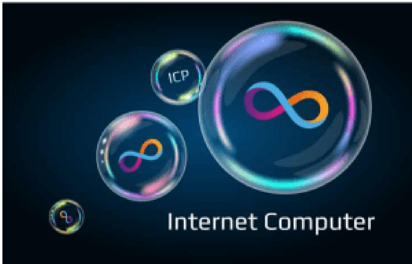
Gráfico ICP a USD (ICP)