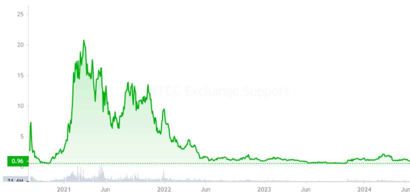
BTCC : Graphique de prix de SUSHI

Vous trouverez ci-dessous les prix historiques de SUSHI. Connaître les performances passées de ce token nous aide à prédire le prix de SushiSwap et à faire le bon choix d'investissement.