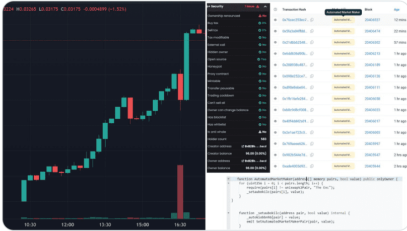
10:40 AM · Jul 28, 2024 · 26.5K Views

온체인 데이터 플랫폼 겸 토큰 공급량 감사 툴 버블맵(Bubblemaps)이 공식 X(구 트위터)를 통해 “이더리움(ETH) 기반 밈코인 네이로(NEIRO) 내부자가 방금 전 650만 달러 상당의 NEIRO 토큰을 매도했다”고 경고했습니다.