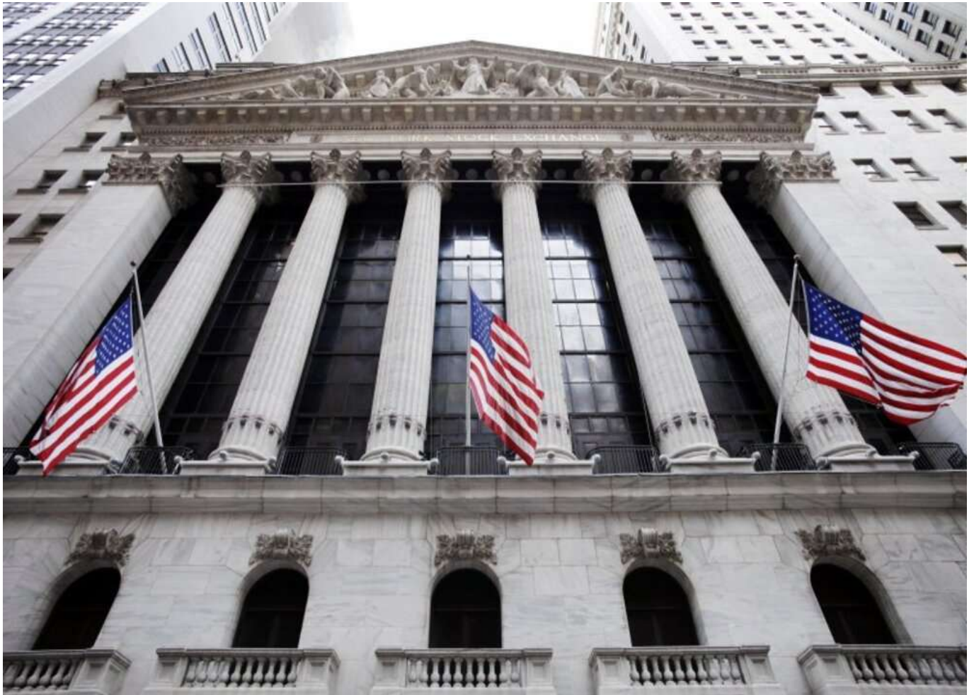
花旗預測聯准會降息

花旗分析師在本月的報告中預測，聯準會將在本週的利率會議期間強烈暗示 9 月降息。分析師預計，從9月起，聯準會將連續八次降息25個基點，最終在2025年7月實現3.25%至3.50%的目標利率。