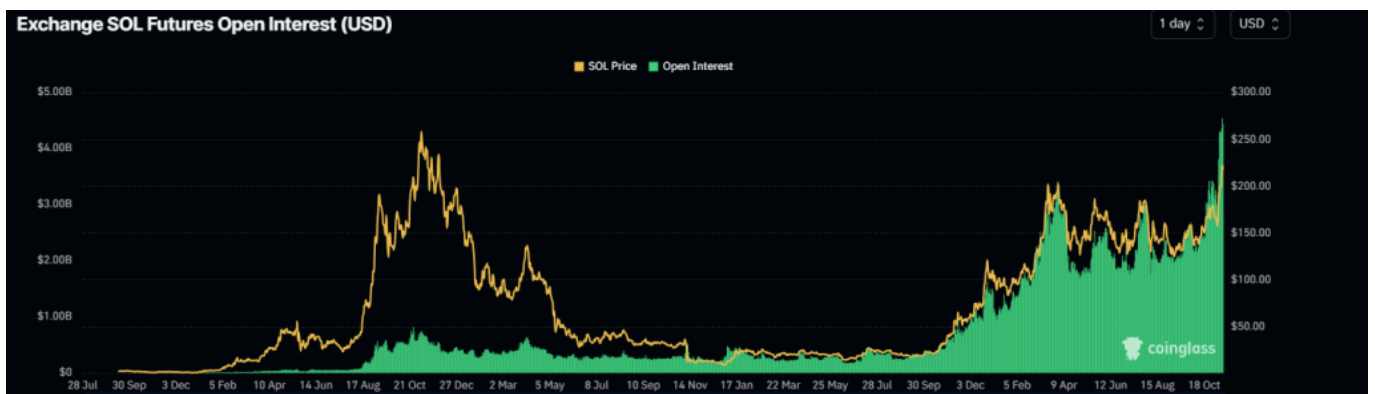
SOL 未平倉合約圖表

從下圖可以看到，SOL 的 OI 從 11 月 5 日的 28.8 億美元升至周二的 45.4 億美元，創下歷史新高。