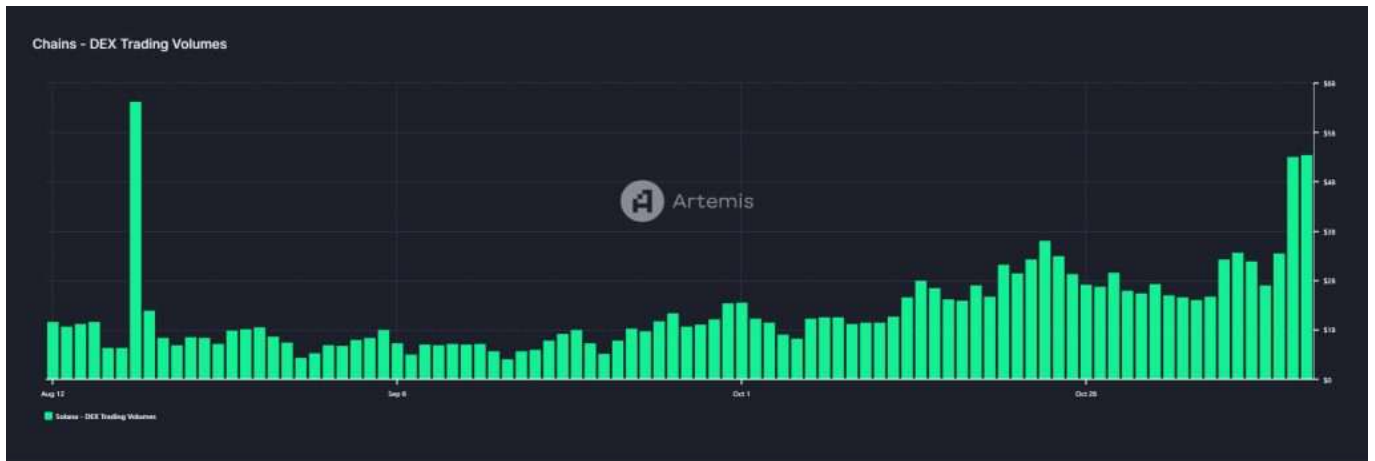
Solana DEX 交易量圖表

同時，Solana 的 非同質代幣 (NFT) 市場 Magic Eden 在過去 30 天內記錄了 77,160 個活躍地址，與以太坊的 OpenC (37,940 個活躍地址) 相比，用戶數量急劇增加。這表明網路在 memecoin 交易之外得到廣泛採用，並支持未來 SOL 價格上漲的可能性。